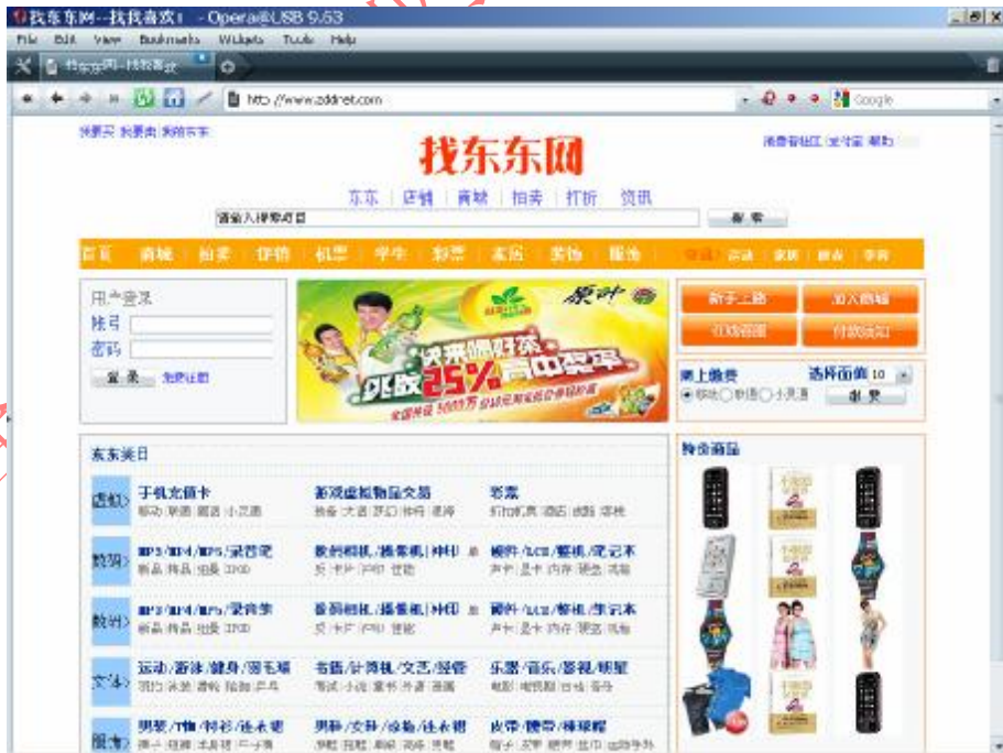
图 2-1 某公司电子商务网站首页截图

某公司电子商务网站首页如图 2-1 所示。网页制作使用了 CSS 技术, CSS 文件 style.css 位于发布目录 c:\website 下的 css 目录中。